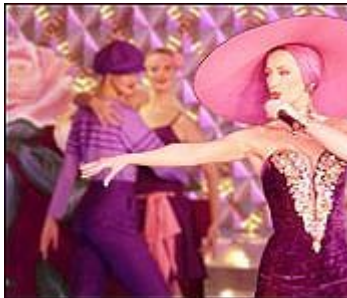
la vie en rose